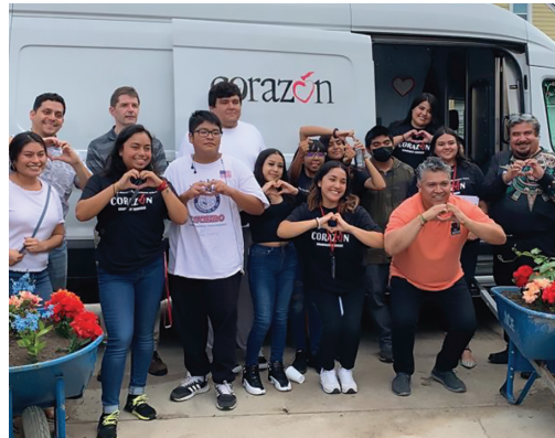
Con el personal y amigos de Corazón Community Services