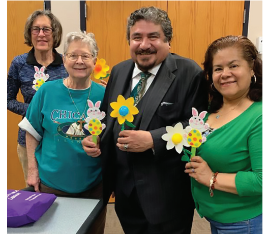
En la Biblioteca Cicero con el grupo de Manualidades para Personas Mayores durante su reunión bimensual