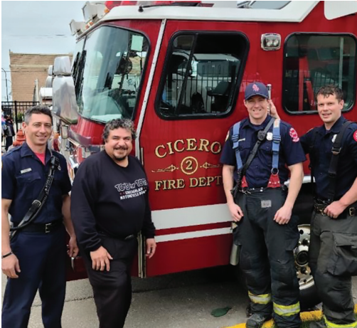
Con Socorristas de Cicero