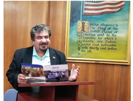
Presentando el Informe del distrito en la junta de Summit