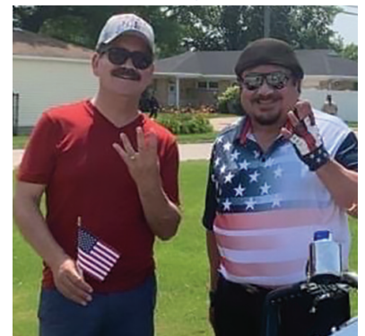
Con el Congresista Jesús "Chuy" García en el desfile del 4 de julio de Westchester