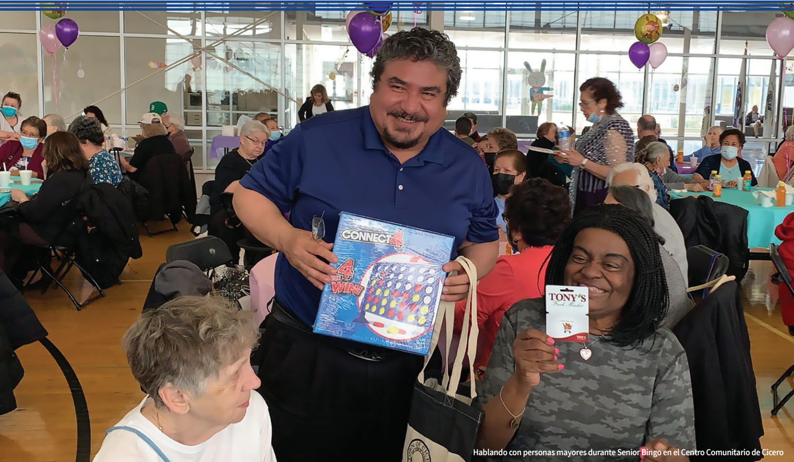
Hablando con personas mayores durante Senior Bingo en el Centro Comunitario de Cicero

★ INFORME DEL DISTRITO 16 | OTOÑO 2022 ★